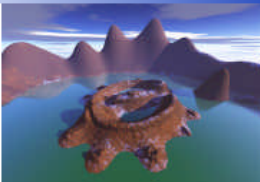
ABB 中国 ABB China